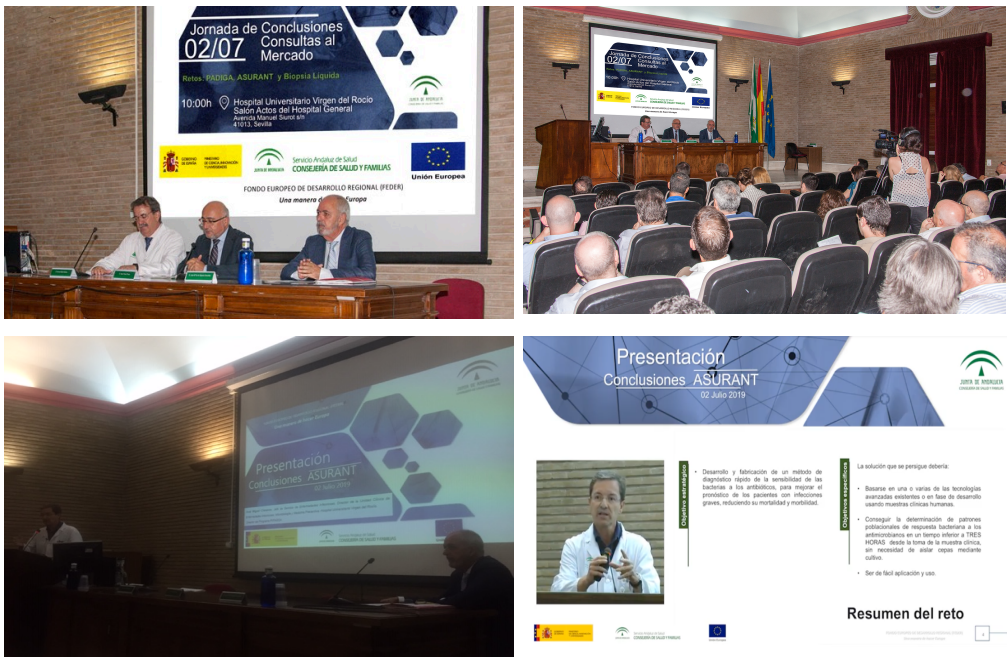
Ilustración 4: Jornada de Presentación de Conclusiones de la CPM de Asurant, 02 julio de 2019

El 02 de julio de 2019 se celebró una jornada de presentación de las conclusiones de la Consulta Preliminar al Mercado de Asurant dirigida a todos los profesionales y entidades interesadas