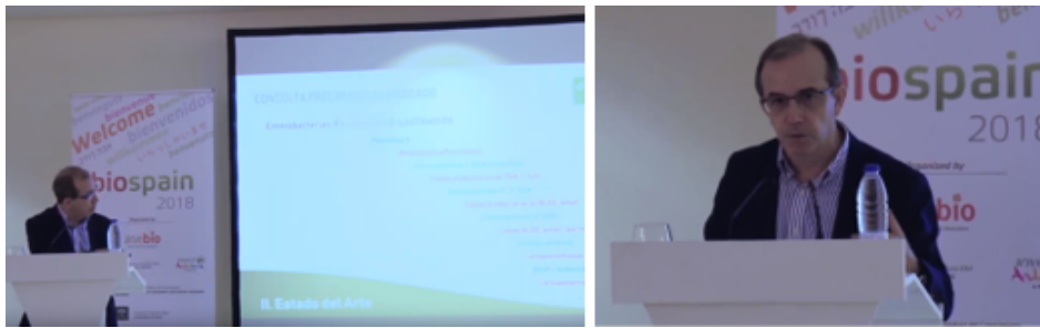
Ilustración 1: Jornada de Presentación CPM Asurant, 27 de septiembre de 2018.

El documento de preguntas y respuestas (Anexo III) 7 , así como las presentaciones utilizadas por los ponentes de la Jornada de Información en sus intervenciones, fueron puestas a disposición de los interesados en la página web del Servicio Andaluz de Salud 8