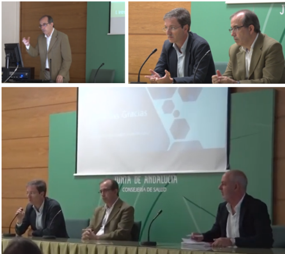
Ilustración 2: Taller Informativo sobre la CPM de Asurant, 16 de octubre de 2018.

El 16 de octubre de 2018 se celebró un taller informativo dirigido a aquellas entidades interesadas en participar en la Consulta Preliminar al Mercado de Asurant.